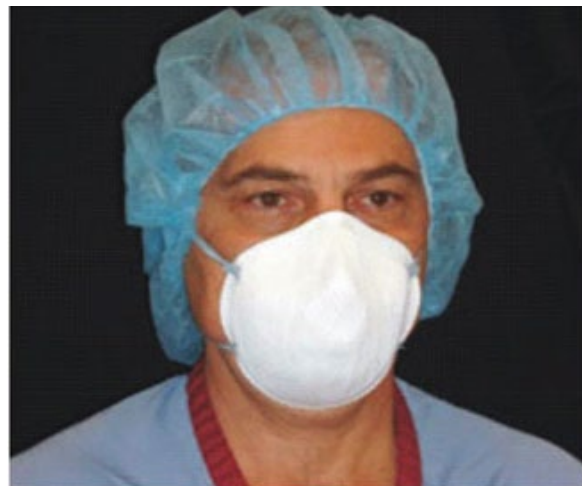
Figura 2: Respirador N95 ajustado herméticamente al rostro y con mascarilla de filtrado de partículas (sellado contra la piel)