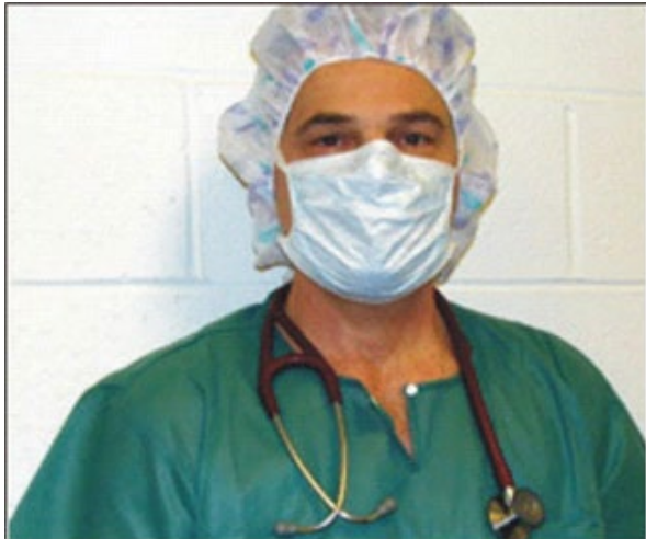
Figura 1: Mascarilla quirúrgica que no queda ajustada

Para informarse más sobre los dispositivos de protección respiratoria en entornos de atención médica, vea el: OSHA/NIOSH Hospital kit del Programa Hospitalario de Protección Respiratoria de OSHA/NIOSH .