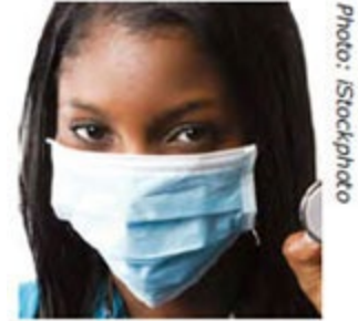
Mascarilla quirúrgica, no se ajusta a la cara y crea espacios por donde pueden entrar partículas. Autorizado por la FDA

Las mascarillas quirúrgicas pueden ayudar a bloquear las gotitas más grandes de partículas, derrames, aerosoles o salpicaduras, que podrían contener microbios, virus y bacterias, para que no lleguen a la nariz o la boca. Sin embargo, se usan principalmente para procurar proteger a los pacientes de los trabajadores de la salud, reduciendo su exposición a saliva y secreciones respiratorias. No crean un sello hermético contra la piel ni filtran los patógenos del aire muy pequeños, como los que son responsables de enfermedades de transmisión aérea.