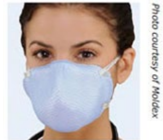
Respirador N95 quirúrgico con mascarilla de filtrado, con buen ajuste y resistente a líquidos. Probado y aprobado por NIOSH y autorizado por la FDA.

Los respiradores N95 quirúrgicos proporcionan la protección respiratoria de los respiradores N95 y la protección contra aerosoles y salpicaduras de las mascarillas quirúrgicas. Estos productos están aprobados por NIOSH como respiradores N95 y autorizados por la Administración de Alimentos y Medicamentos (FDA) como dispositivos médicos.