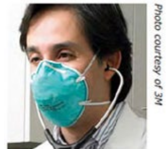
Respirador N95 con mascarilla de filtrado, con buen ajuste. Probado y aprobado por NIOSH

En la mayoría de los casos, en los entornos de salud, se usan los respiradores N95 aprobados por NIOSH con mascarilla de filtrado para proteger a quienes los usan de las partículas en el aire, que incluyen patógenos. Tenga en cuenta que los respiradores N95 no protegen contra gases, vapores o aerosoles y que podrían proporcionar poca protección contra derrames directos de líquidos.