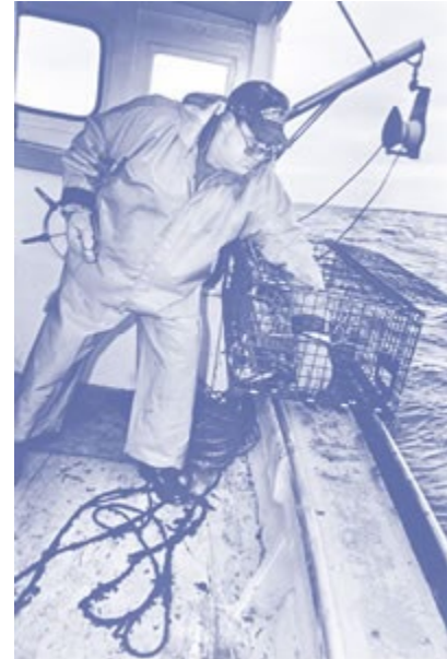
Figura 1. Pescador de langosta mientras sube una trampa de una sola langosta.

Para obtener la información requerida en la encuesta, se elaboró una guía para las entrevistas y se entrevistaron a 103 pescadores de langostas entre 1999 y 2000. Cerca del 73% de los entrevistados respondieron “Sí” a la pregunta “¿Alguna vez ha quedado atrapado en una línea de nasa (y, como consecuencia, perdió sus prendas de vestir), fue arrastrado a la popa o cayó al agua?” En los últimos 5 años, habían quedado enredados el 44% de los pescadores, algunos más de una vez. La mayoría de los pescadores de langostas indicaron que los enredamientos ocurrieron principalmente cuando estaban preparando o moviendo el equipo. Éste es también el momento cuando casi toda la línea está en la cubierta (Figura 1).