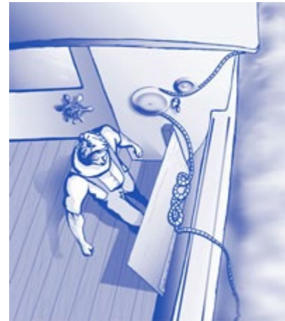
Figura 3. Repisa para la línea, hecha de madera contrachapada, con una bisagra que permite colocar la repisa en posición horizontal y depositar en ella la línea del halador de canastas. Ilustración de Media Stream.