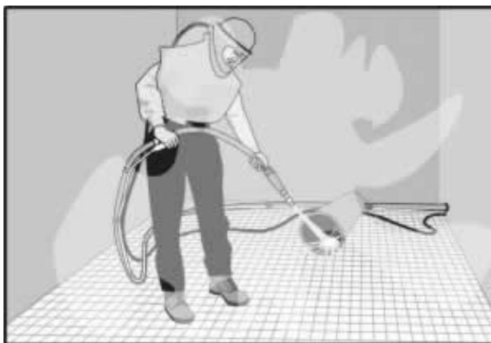
Figura 2. Operador de una máquina de limpieza por chorro de arena con el equipo de protección respiratoria adecuado dentro de una cabina ventilada. Nótese que se suministran al trabajador dos líneas separadas de aire— una para proveer el aire limpio que el trabajador respira y otra para suministrar el aire que necesita la máquina para efectuar la limpieza.

A veces los controles técnicos se llaman controles de la fuente cuando están diseñados para eliminar o reducir las exposiciones en la fuente.