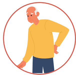
Dificultad para respirar