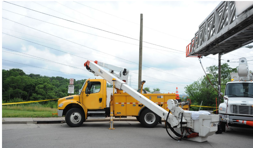
Camión grúa con elevador de pluma articulada Freightliner M2