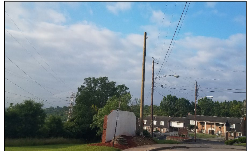
Nuevo poste con cámara al fin de la calle sin salida