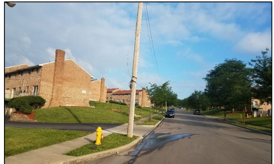
Postes de luz a lo largo de la calle