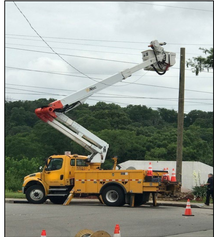
Posición del camión grúa en la calle sin salida en el momento del incidente.