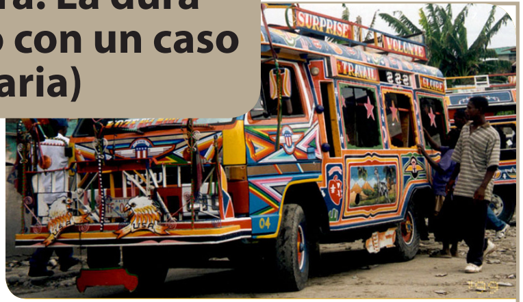
Una imagen típica en Haití: un bus "tap-tap".